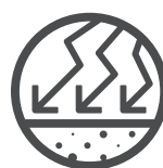
Hohe Haltbarkeit und Belastbarkeit