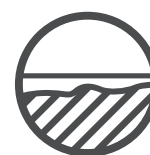
Unebene Oberflächen ausgleichen