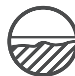
Unebene Oberflächen ausgleichen